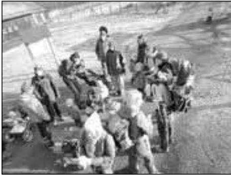
Tierpark in Klein Auheim - die Gruppe komplett

Gleich im Januar trafen sich elf Familien zu einem gemeinsamen Ausflug. Eigentlich stand Schlittenfahren auf dem Programm, aber auf Grund von akutem Schneemangel verschlug es uns in den Tierpark „Alte Fasanerie“ nach Klein Auheim bei Hanau.