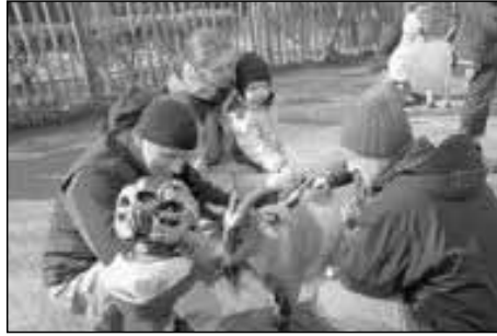
Papa - Sohn - Ziegenbürst - Session

Im Februar trafen sich 7 Familien zum Besuch des Zoo's „Vivarium“ in Darmstadt. Aufgrund eiskalter Temperaturen und Schneemangels bis Mitte Februar erschien uns dies die bessere Unternehmung anstatt der geplanten (Schneeschuh-)Tour auf den Altkönig. Gleich zu Anfang begeisterte uns und vor allem unsere Kinder das begehbare Känguruh-Gehege. Weiterhin begegneten wir lustig tanzenden Affen, tropischen Fischen, exotischen Reptilien und im Schmetterlingshaus konnten farbenprächtige Schmetterlinge auf uns landen. Im schön angelegten Vogelbereich hatten wir die Idee, ein Kinder-Gruppenbild zu machen, was bei sieben Kleinkindern eine amüsante Aufgabe ist. Mithilfe von karnevalistischen Gesangs- und Tanzeinlagen haben wir tatsächlich alle Kinder auf ein Foto bekommen! Belohnt wurde ihre Geduld im Streichelzoo, wo Bürsten auslagen, mit denen