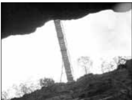
Stangensteig führt über den Höllentalkamm

Das Höllental beginnt in Hammersbach (763 m), an einer kleinen Kapelle. Will man von hier aus den Gipfel erreichen, hat man 2210 Höhenmeter zu überwinden, dazu muss man aber schon morgens starten! Wir wollten heute aber nur die Höllentalangerhütte auf 1379 m erreichen, von hier sind immerhin noch knapp 1600 Hm zu absolvieren. Der Hüttenzustieg ist interessant, nach gut 2 km wird die rund 1000 m lange Höllentalklamm erreicht, die steil entlang des wildwasserdurchtosenden Baches durch hohe Felschluchten und gesprengte Gänge führt (Regenkleidung/Rucksackschutz). Wenn die Klamm geschlossen ist, bietet sich der Stangensteig an, der kurz vor dem Klammeneingang – rechts abbiegend – beginnt, der aber