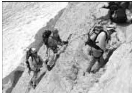
Am Klettersteig nach Bergschlund

Es folgt dann ein recht langer Schotterhügel, der unangenehm zu gehen ist, bis der kleine Gletscher erreicht wird. Mit Steigeisen waren die Blankeispassagen gut zu überwinden. Wir umgingen die sichtbare Spaltenzone und querten dann fast waagrecht nach rechts zur oberen Randkluft, die derzeit unproblematisch war, was nicht immer der Fall ist! Bis hierher hatten wir bereits fast 1100 Höhenmeter absolviert. Nach Überwindung der Randkluft waren noch rund 500 Höhenmeter durch die steile Ostwand des Nordgrates – klettersteig-