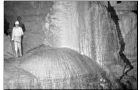
Salle de Dentelles

Doch nein, da oben hängt eine Seilschlaufe. Der letzte Durchquerer hat offenbar aus Versehen das Seilende hochgezogen. Das kann passieren, aber wir sind blau vor Frust. Solche Anfängerfehler hier, Sauerei. Wir könnten zurück, aber daran denken wir nicht - das Seil muss da runter.