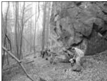
Die Magnetsteine bei der Burg Frankenstein

Im März trafen sich sechs Familien am Parkplatz der Burg Frankenstein im Odenwald zur Panoramawanderung zu den Magnetsteinen. Die Ausblicke in das Rheintal und den Odenwald konnten leider nicht genossen