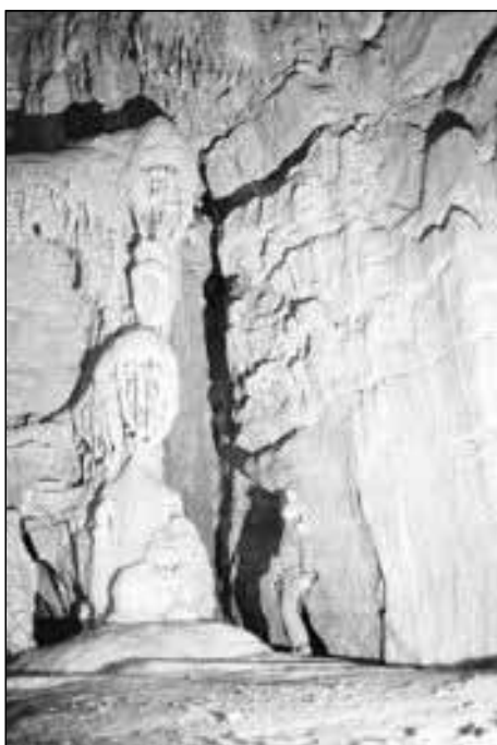
Galerie de Lacuse