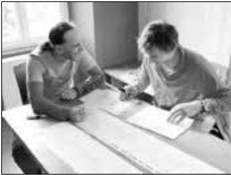
Planung ist alles

Über die begeisterten Reaktionen auf meinen letzten Höhlenvortrag Anfang März habe ich mich sehr gefreut. Es gibt anscheinend auch Fans der Höhlengruppe, die wirklich meine Berichte lesen. Also dann, hier das letzte Abenteuer 2011.