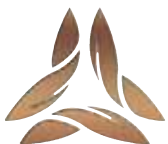
Tessin Lady Identity