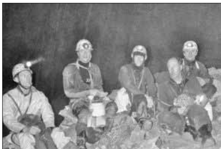
Salle du Bon Negro