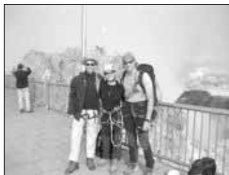
Die Zugspitze - 2962 m hoch