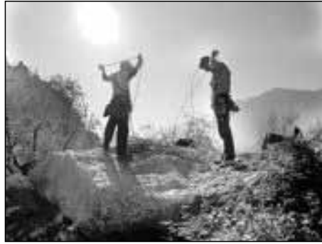
Auf dem Colodri bei Traumwetter nach 10 SL

Die erste 6a-Sequenz war eine diffizile Plattenstelle, welche sich aber super auflöste. In der vorletzten Seillänge kam noch