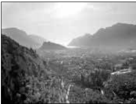
Blick vom Colodri über Arco zum Gardasee

Am 11. 11. 2011 machten wir uns mit einer kleinen Gruppe auf den Weg in's sonnige Arco, unweit des Gardasees. Wir hatten Traumwetter in den folgenden sechs Tagen