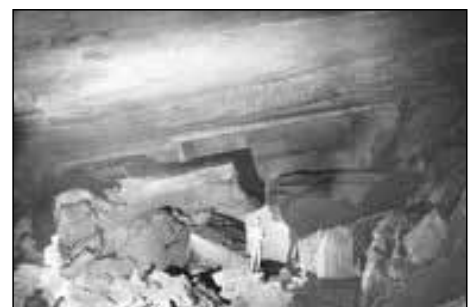
Salle du Gnome

Bis wir alle das 40 m Seil auf, Seil ab und hinter dem Siphon sind, ist eine weitere Stunde vergangen. Bald folgen die riesigen Hallen des Salle du Gnome. Unsere sechs Lichter wirken etwas verloren. Hier beginnt der anspruchsvolle