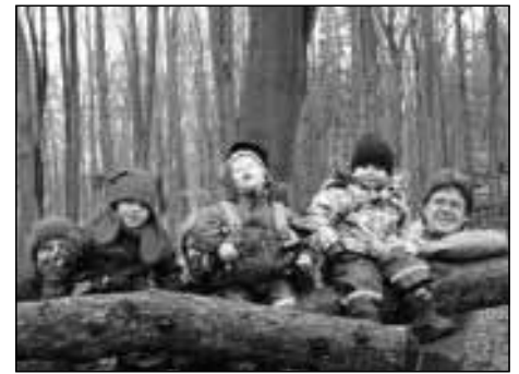
Baumwippen macht Spaß

Die Kinder hatten auf den Waldwegen viel Spaß und fast alle liefen die 3 km lange Strecke. Auf dem Rückweg war ein umgestürzter Wippenbaum eine tolle Attraktion, die es sofort zu bespielen galt. Alle Kinder konnten auf dem umgestürzten Baum sitzen und wippen. Da wollte natürlich niemand weiterziehen. Nochmals und nochmals wurde gewippt, bis den Großen die Arme erlahmten.