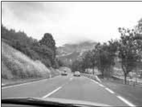
Ankunft im Zugspitzgebiet