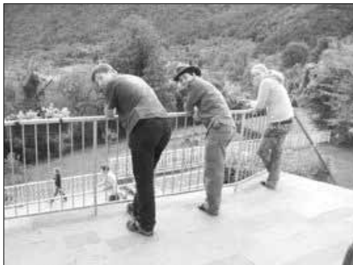
Blick vom Haus in Richtung Gardasee

Obwohl am dritten Tag in Nago ein kalter Wind wehte, testeten wir danach einen der unzähligen Eissalons Arcos und kauften fleißig in den Klettergeschäften ein, die sich