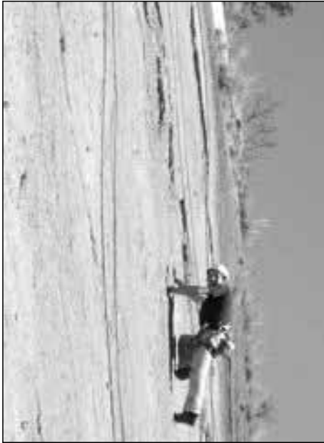
Nico in Baone

dort ebenso Tür an Tür reihen. Abends dann, nach einem wieder einmal leckeren Essen, wurde durch komplizierte Berechnungen der Gewichtsverhältnisse ausgehandelt, wer mit wem eine Seilschaft bilden sollte, wurden Topos abgemalt und Material sortiert.