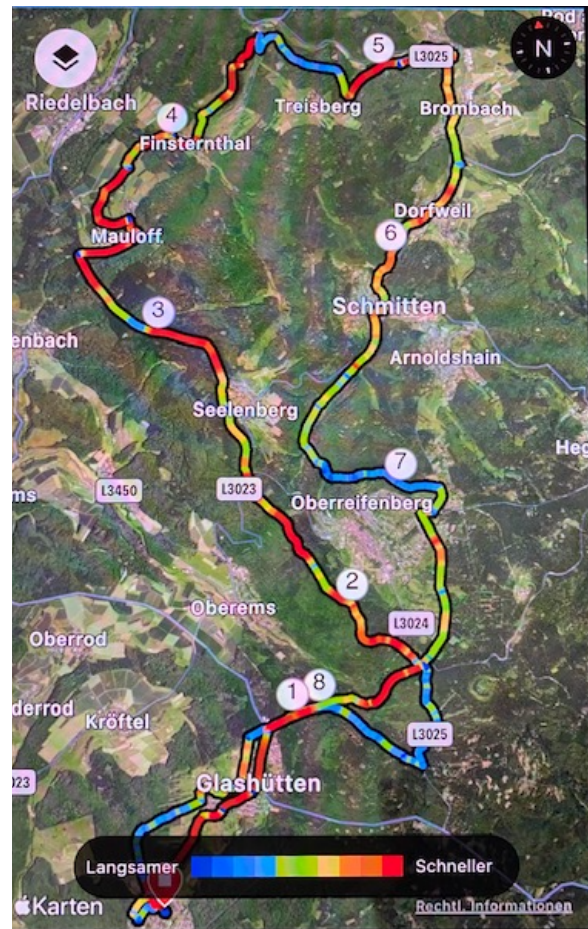
*Toureausschnitt von Schlossborn in anderer Richtung